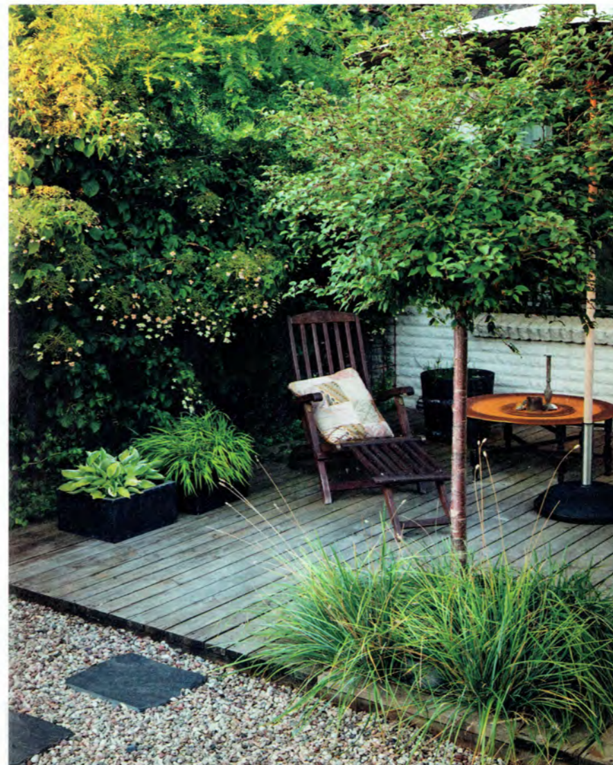
Variationen mellan trädäck och grus markerar olika funktioner – här är viloplatsen.

→ Formspråket domineras av mjuka och lättförståeliga linjer. Att använda sig av geometri, som Camilla och Oscar har gjort med hjälp av cirklar och cirkelbågar, skapar en inneboende balans – formerna upplevs lika harmoniska från vilket håll man än ser dem. De raka linjerna ger fina brytpunkter (referenspunkter), och däri uppstår en härlig kontrast. Att den runda formen kommer igen i till exempel trädkronor är en härlig förlängning och upprepning av trädgården – fast på höjden.