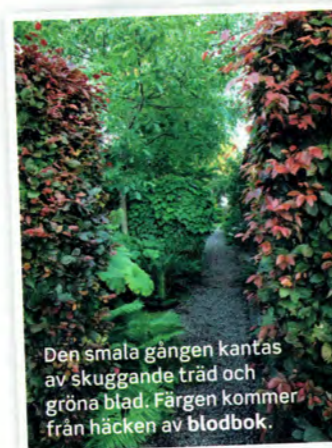
Den smala gången kantas av skuggande träd och gröna blad. Färgen kommer från häcken av blodbok.

1. Köksträdgård. 2. Smal gång med träd och skuggperenner. 3. Entré från gatan. 4. Häck mot gatan med rad av lindar. 5. Trädäck. 6. Innergård med singel, trampstenar och bonsai. 7. Bokcirkeln (helt enkelt en cirkel av bok). 8. Sidoentré med häck av vildvin och klot av buxbom. 9. Bambulund med hängmatta.