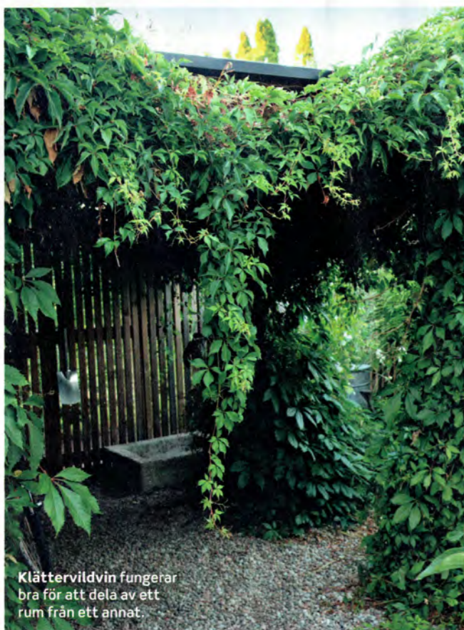
Klättevildvin fungerar bra för att dela av ett rum från ett annat.