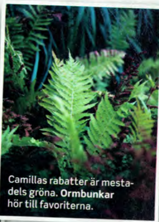
Camillas rabatter är mestadels gröna. Ormbunkar hör till favoriterna.