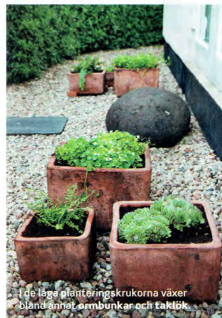
I de låga planteringskrukorna växer bland annat ormbunkar och taktök.